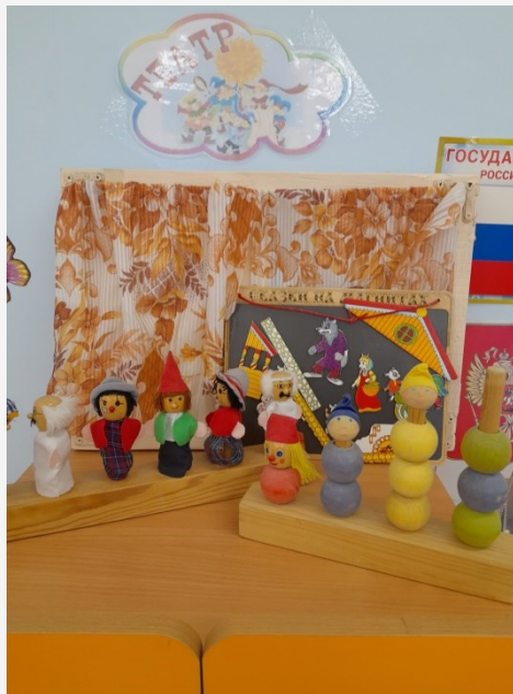
Театральная маленькая ширма